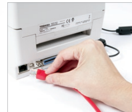
Interface LAN 10/100 Mbps intégrée en standard