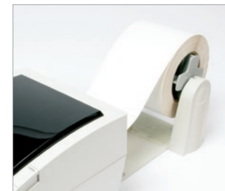
Le support rouleau externe est l'une des nombreuses options

Si polyvalente qu'elle sait même imprimer des médias spécialisés