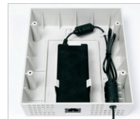
Un cache d'alimentation optionnel pour les installations en magasins